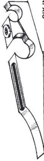
HERBEN MAGNACAM GTO 46/52